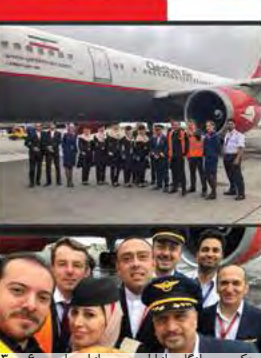
عکس یادگاری از اولین پرواز ایرباس ۳۰۰-۶۰۰ قشم ایر به فرودگاه شرمینف مسکو در سال ۲۰۱۷ که با انجام مراسم و تر سالوات و استقبال مدیران فرودگاه همرام بود