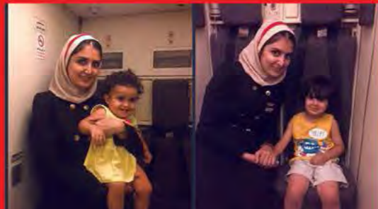
فرهام و مه فام کوچولو مسافر کوچولوهای زیبا و خوش اخلاق پرواز قشم-تهران قشم ایر