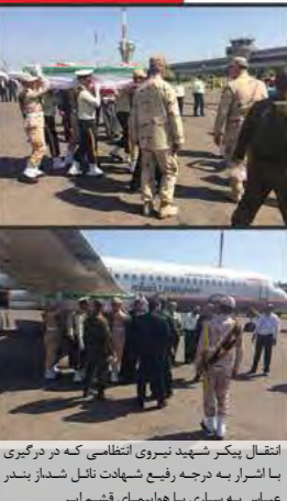
انتقال یکم شهید نیروی انتظامی که در درگیری با اشراز به درجه رفیع شهادت نائل شداز بندر عباس به ساری با هواپیمای قشم ایر