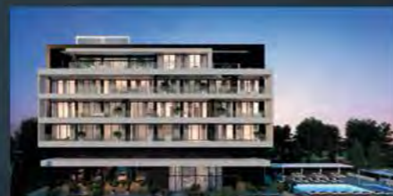
SPECTRUM BOUTIQUE COASTAL APARTMENTS | LIMASSOL