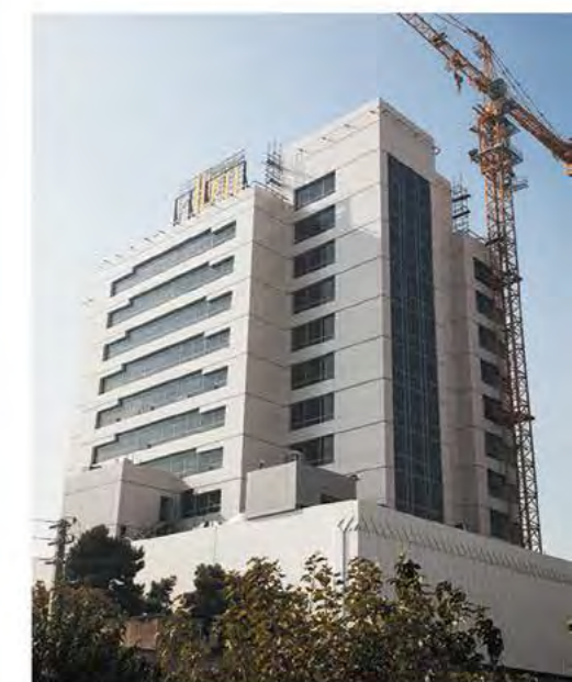
Royal commercial & Administrative Center