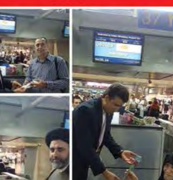
حضور هنرمند موسیقی کشورمان جناب آقای سیروان خسروی در پرواز قشم ایر