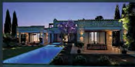
IMPERIAL RESIDENCES | VENUS ROCK GOLF RESORT, PAFOS

قبرس امن ترین کشور در کل اروپا و پنجمین کشور امن در دنیا. جذاب ترین کشور برای تجارت و بهترین مکان برای سکونت است. در نگاهی منحصر به فرد در زمینه سرمایه گذاری در املاک، بهره بردن از موقعیت استراتژی مکانی بینظیر این کشور، سبک زندگی غافلگیرکننده مدیترانه ای، آب و هوای فوق العاده، زیرساخت های درجه یک در زمینه توریست و پر انگیزه ترین منطقه در زمینه های مالیاتی می باشد. جزیره قبرس کار آمدترین برنامه های اخذ تابعیت و اقامت دائم اروپا با سرمایه گذاری در املاک را ارائه می کند.