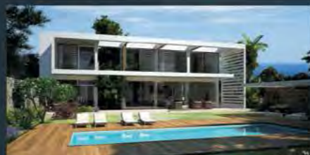
HILLCREST RESIDENCES | LIMASSOL