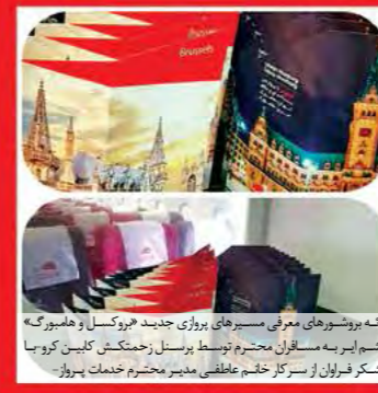
ارگه پروشورهای معرفی مسرهای پروزی جدید «پروکسل و هامبورگ» قشم ایر به مسافران محترم توسط پرسنل زحمتکش کابین کروز با تشکر فراوان از سرکار ختم عاطفی مدیر محترم خدمات پرواز-