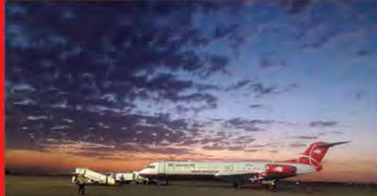
هواپیمای قشم ایر و غروب زیبا با تشکر از جناب آقای حسین زاده همکار قشم ایر