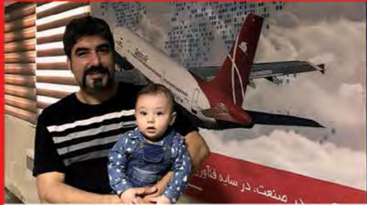
نوادین کوچولوی اشتی-آخر هفته در قشم ایر