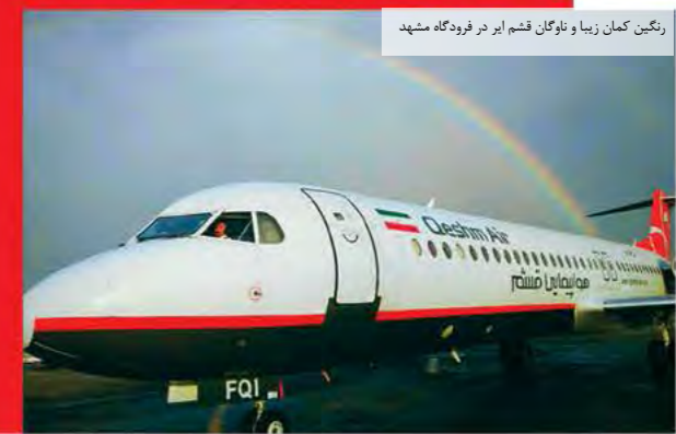
رنگین کمان زیبا و نابوگان قشم ایر در فرودگاه مشهد

کتاب تلگرام قشم ایر یک ساله شد: با همراهی مسافران گرمی و پرسنل پروازی قشم ایر به مناسبت یکمین سالگرد تأسیس هواپیمایی قشم ایر، کتاب تلگرام قشم ایر یک ساله شد. این کتاب به زینت بخش پروازهای شرکت است و آمیزش به یادماندنی شاهد حضور پررنگ پرواز قشم ایر در تمام