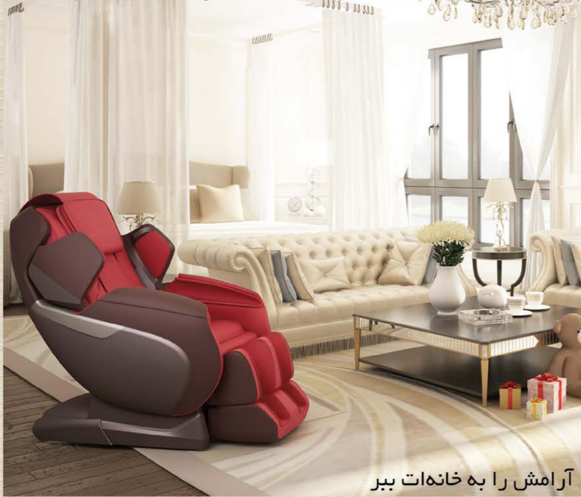
آرامش را به خانه‌ات ببر

تهران، خیابان ملامدرا، ضلع شمال غربی تقاطع ملامدرا-کردستان، کوچه فرشید، پلاک ۴، طبقه ۵، واحد ۱۰ پاسخگوی ۲۴ ساعته خدمات پس از فروش: ۰۹۱۲ ۸۱۹ ۷۴ ۷۹ دارای دو سال بیمه‌نامه ایران برای صندلی‌های ماساژور، دو سال گارانتی و ده سال خدمات پس از فروش برای کلیه محصولات